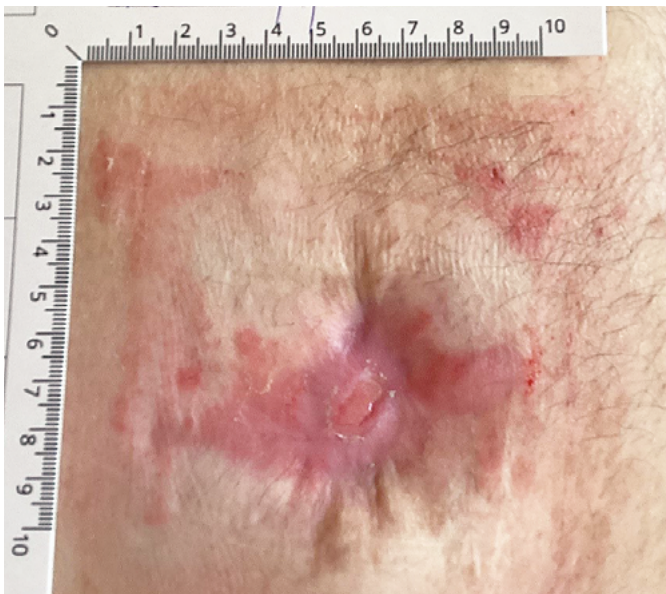
◆ Po 3. aplikaci Amniodermu, reepitelizace defektu