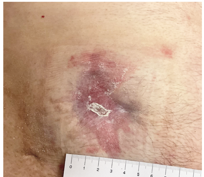
◆ Před dohojením po odpadnutí exfoliovaného strupu; od 7. 4. jen promazávání