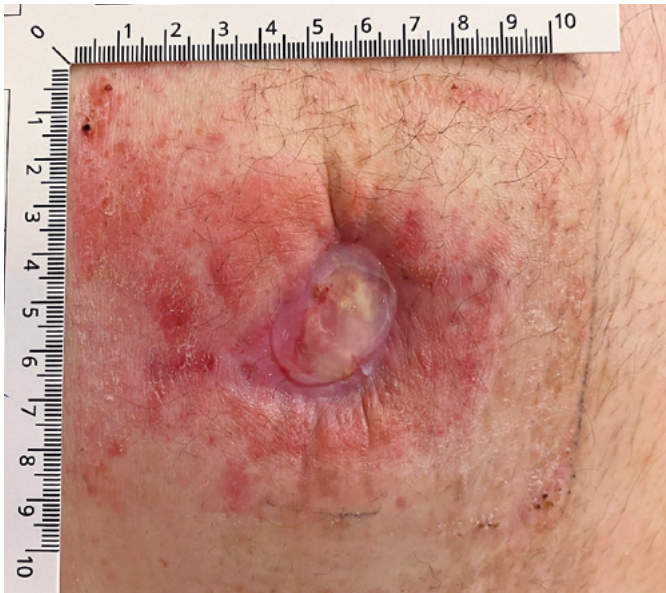
◆ Po 1. aplikaci Amniodermu