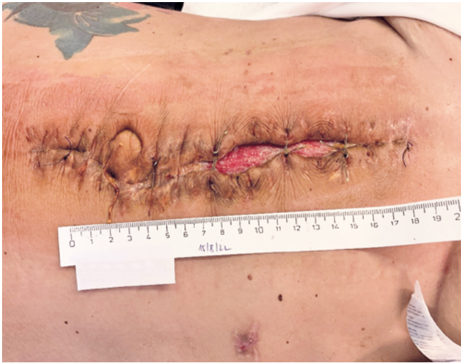
◆ Defekt před 1. aplikací Amniodermu, čistá spodina