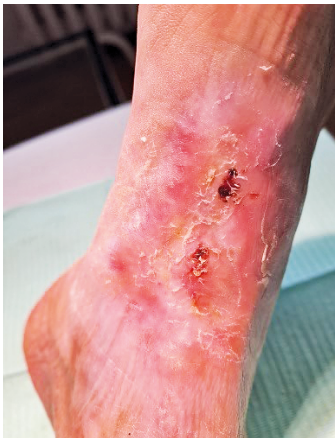
● Obr. 5 a 6: Zhojený defekt