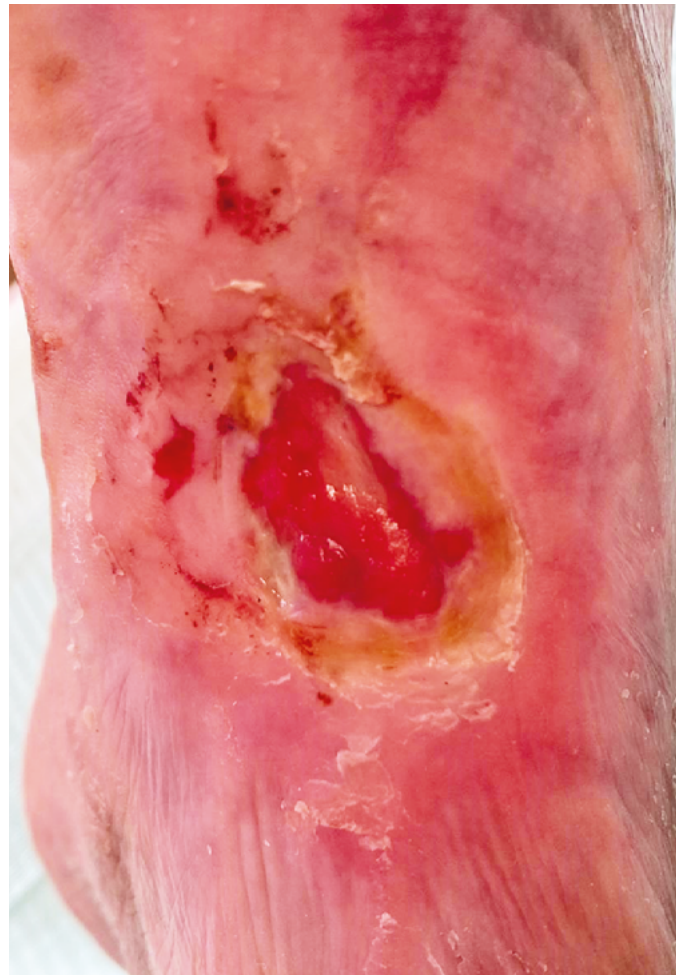
● Obr. 1 a 2: Rána před aplikací Amniodermu